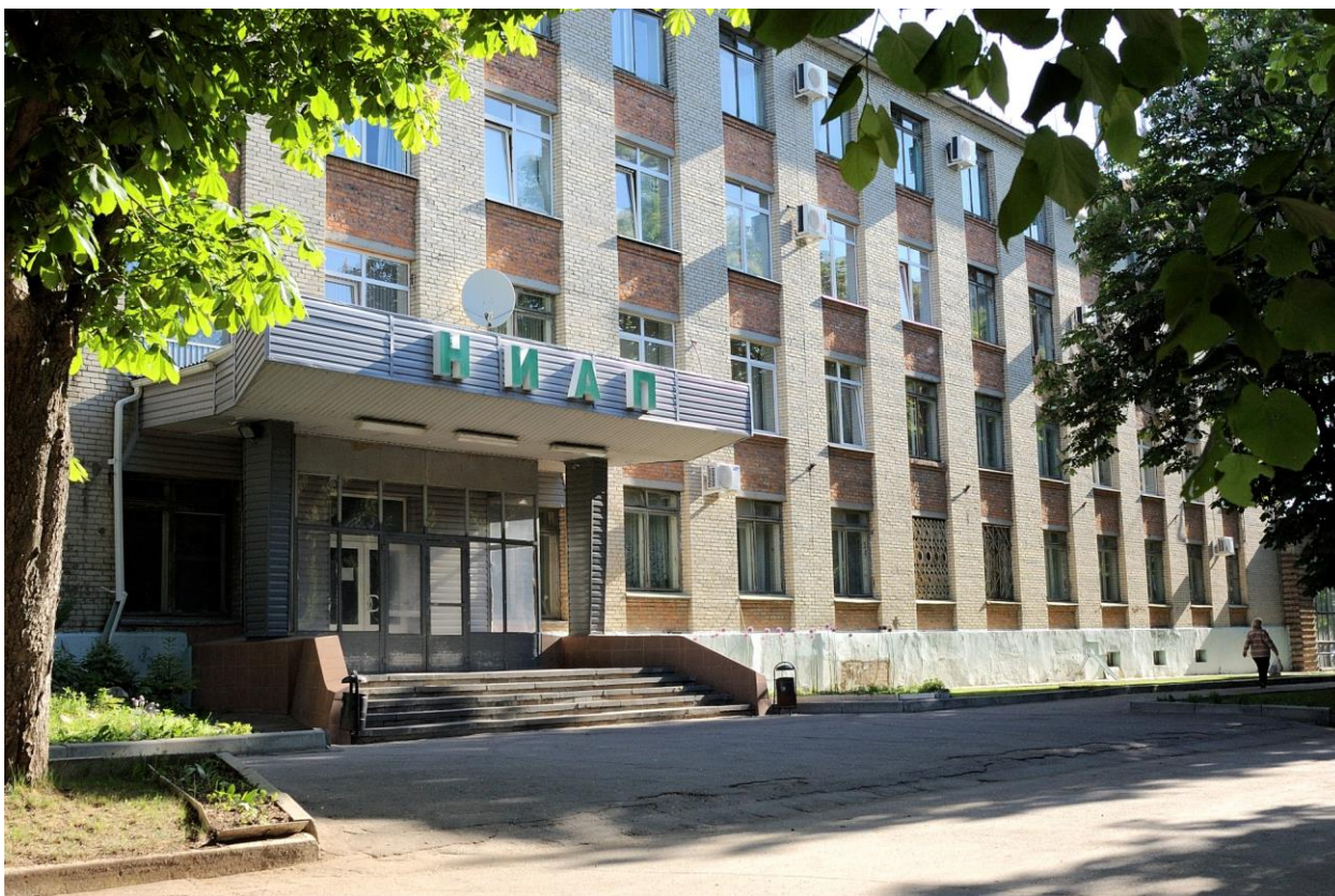
Новомосковский филиал Государственного института азотной промышленности

Последний объект нашей экскурсии - ГИАП (административное здание, на котором находится мемориальная доска о заложении капсулы времени)