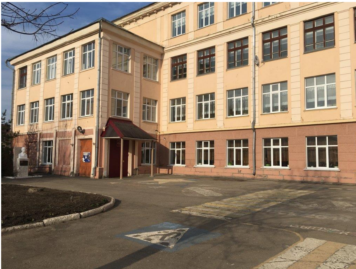
МБОУ «Гимназия «13»

Следующее образовательное учреждение на нашем пути - МБОУ «Гимназия «13».