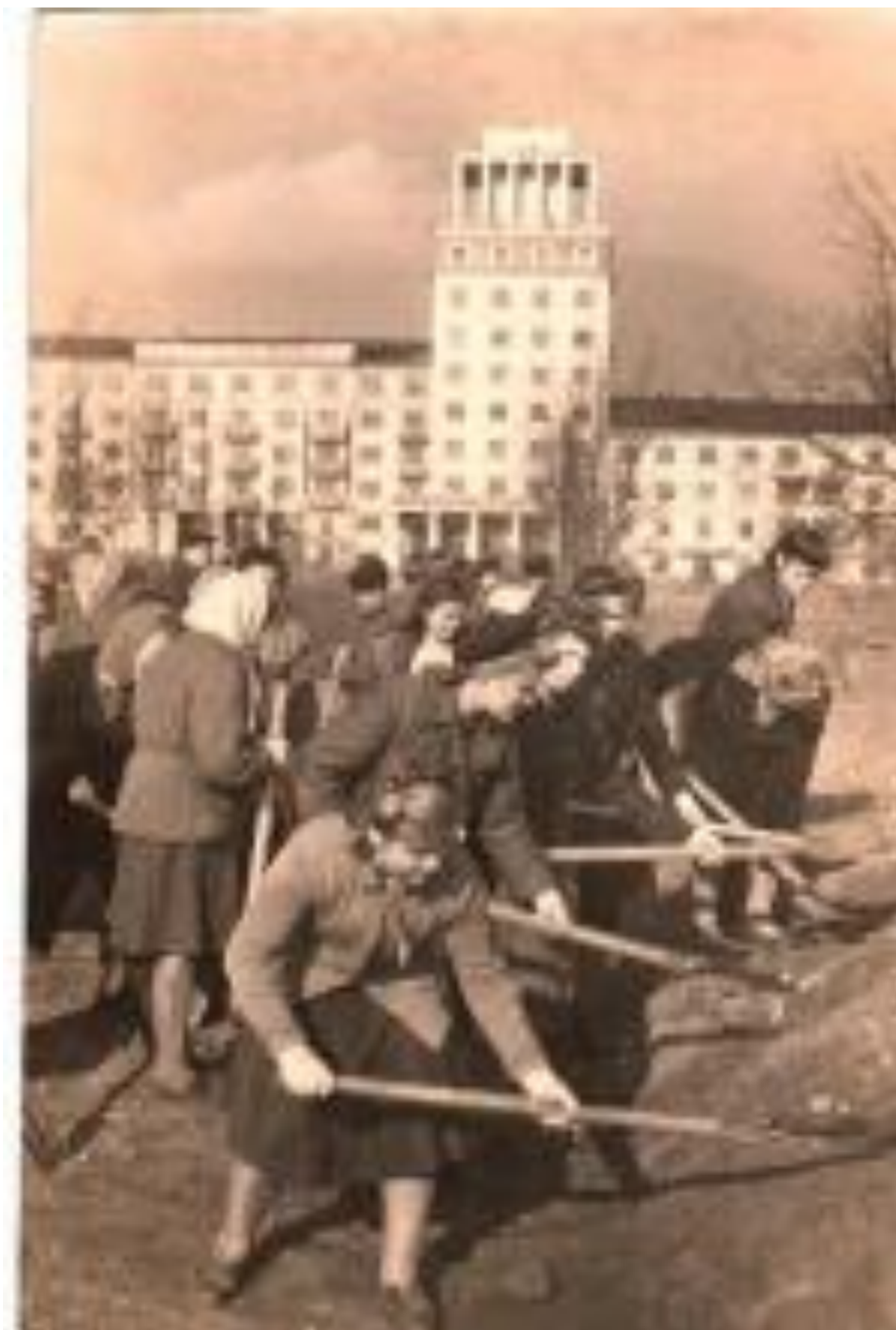
Благоустройство городского сквера 30-летия ВЛКСМ