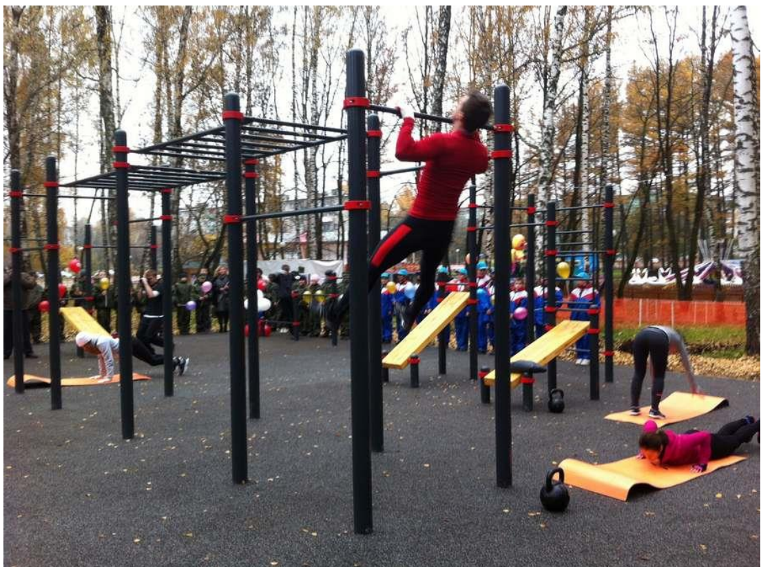
Площадка воркаута в сквере