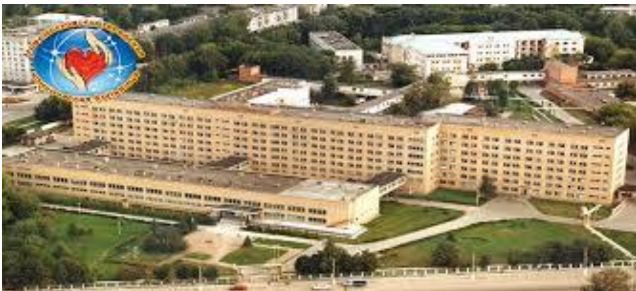
Новомосковская городская клиническая больница

Недалеко от библиотеки находятся корпуса Новомосковской городской клинической больницы.