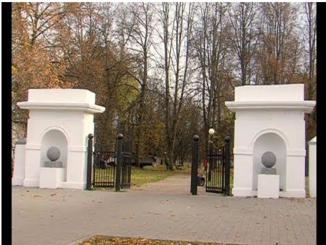
Вход в сквер 30-летия ВЛКСМ со стороны улицы Москвой