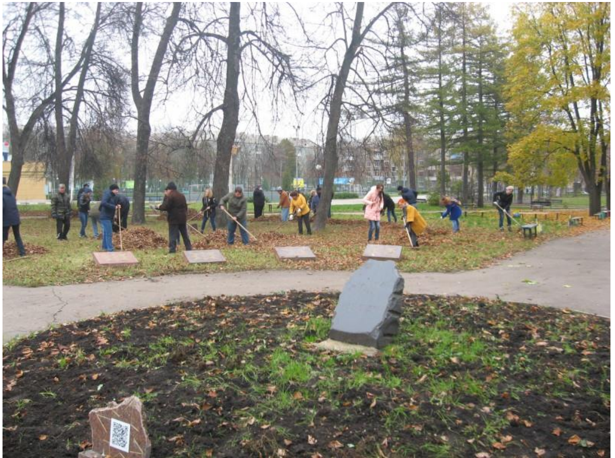
Ежегодный субботник в сквере